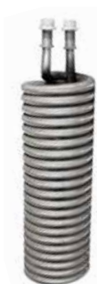
Serpentines de cobre Aleteado estañado