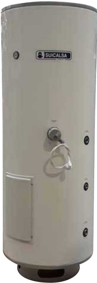
La resistencia eléctrica de apoyo se suministra como opción