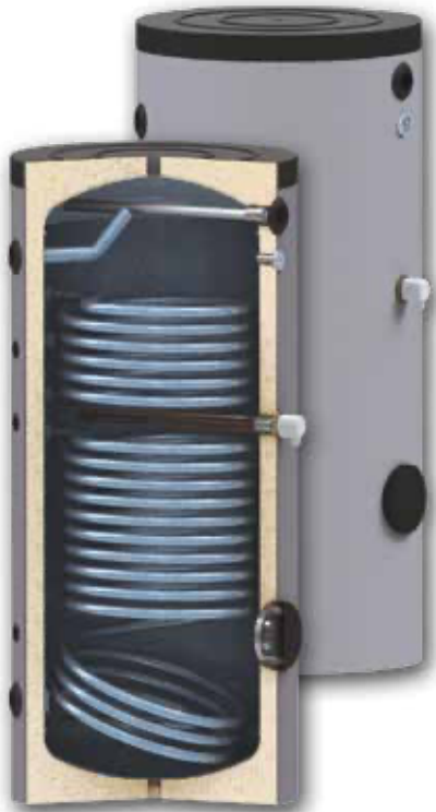
La resistencia eléctrica de apoyo se suministra como opción