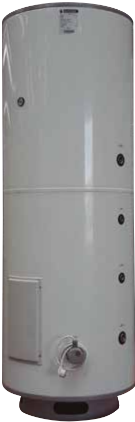
La resistencia eléctrica de apoyo se suministra como opción