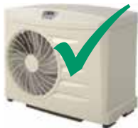
Adecuado para bomba de calor