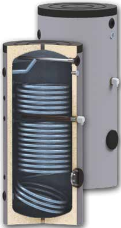
La resistencia eléctrica de apoyo se suministra como opción