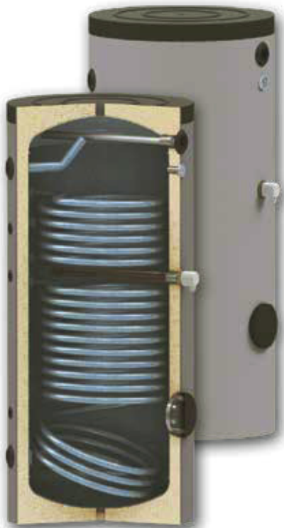
La resistencia eléctrica de apoyo se suministra como opción